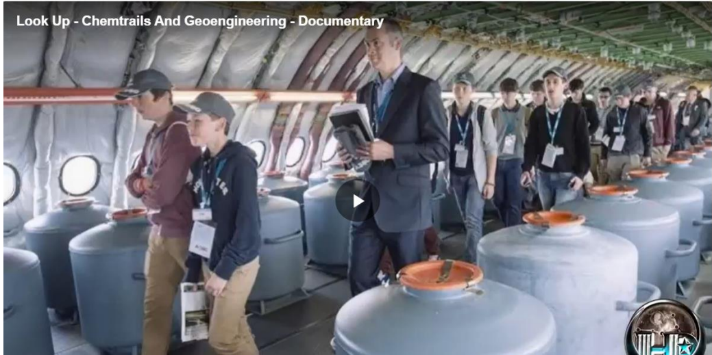
Tanques de gases tóxicos son vaciados a la atmósfera mediante aviones de la NASA. Ver documental “Mien Arriba, Químicos y Geoingeniería” (inglés, 27 minutos)

Look Up - Chemtrails And Geoengineering - Documentary